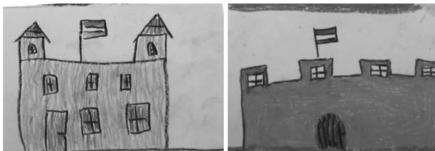
7. ábra Várak

a védelem megjelenéseként értelmezhetőek. A külvilágtól való elkülönülés, a bevehetetlen vár, mint védelem evidenciaként kerül elő a 8-9 éves gyermek fantáziájában. A várábrázolás tehát elérhető eszköz a gyermek számára, ha álmái házáat elsősorban mint védelmet nyújtó, erős építményt szeretnék ábrázolni. De a vár nemcsak a benne élő személy vagy család számára nyújt védelmet, hanem az egész közösségnek is. A várak egy részét a nemzeti lobogó díszíti, ami még tovább tágítja a közösség értelmezését.