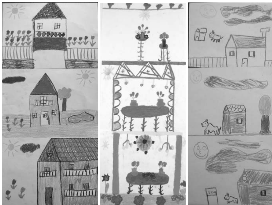
3. ábra Vágyteljesítő jelenábrázolás

Ahogy már a sematikus ábrázolásnál is érzékelhető volt, a ház megrajzolásában, akár a jelenkori, akár a jövőbeli otthonról van szó, még akkor is a vágyteljesítés olvasható ki, ha egyes realizisztikus elemek is szerepelnek rajta. Sokban segítette a rajzok értelmezését, hogy a helyszínen a gyerekek egy részének tényleges lakáskörülményeit is alkalmunk volt megismerni. A rajzolás közben elhangzott megjegyzések és a rajzolást követő beszélgetések is jól tükrözték, hogy a szegényebb gyerekek sokszor nem szívesen beszéltek arról, hogy milyen körülmények között élnek. A gyerekek túlnyomó többsége színesnek és szépnek ábrázolja házukat. Ez a jelenség természetesen tükrözi a gyerekek életkorára jellemző általános elképzelését a világról, miszerint a létező otthon a legjobb, a saját anyukájuk a legszebb, és egyéb vélekedéseket. Ezzel együtt a rajzokon elhelyezett díszítések és feliratok azt a célt is szolgálják, hogy az általuk „normálisnak”, elvártnak tekintett polgári otthon képét mutassák a jelenkori ház ábrázolásánál. Ezt a tendenciát, ugyanezeket az elemeket aztán a felnőttkori képen is gyakran viszontlátjuk.