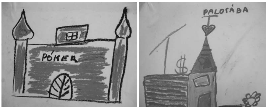
6. ábra A gazdagság szimbólumai

A középosztálybeli álmok mellett megjelennek a gazdagság ismert szimbólumai, vagyis a gyermeki vágyak elsősorban olyan tárgyokban fejeződtek ki, amelyekhez gazdagság, sok pénz szükséges. A gyerekek rajzain néha feltűnik egy-egy rövid szöveg vagy szimbólum. Ilyen például a dollár jel, a playboy nyuszi embléma, a „póker” felirat, a parabola antenna stb. Ezek a választások jól tükrözik az elérni kívánt célokat, a könnyen megszerezhető javakat, a vágyak materiális valóságát, amelyre a feladat jellege is készíthette a gyerekeket, hiszen házakat rajzoltak, amely egyszerre otthon és vagyontárgy. Azonban e speciális, a rajzokon is kiemelt szimbólumok esetében hajlunk arra a következtetésre, hogy e jelek megjelenését a vágyott osztályhoz való tartozás jegyeként tartjuk számon.