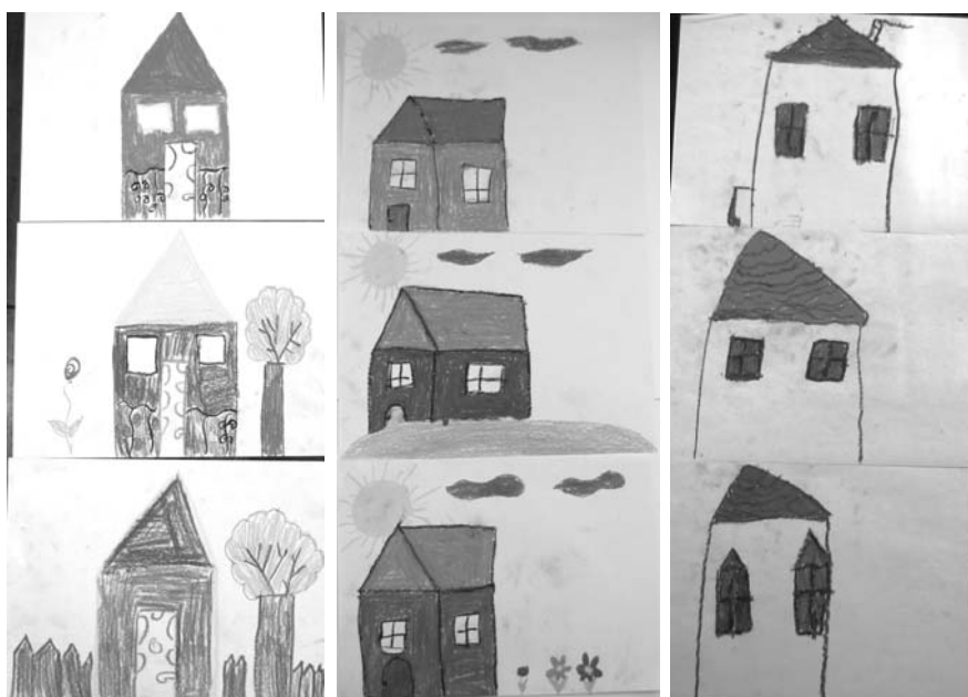
2. ábra. Sematikus házak

volt mód arra, hogy minden egyes rajzot a rajzoló gyerek saját interpretációjában megismerjük, továbbá nem használtunk standardizált rajzvizsgálati eljárást, és a körülmények sem voltak alkalmasak a pszichológiai rajzelemzésre. Nem is ez volt azonban a célunk. Problémafeltáró vizsgálatunk középpontjában elsősorban pszichoszociális, és nem pszichológiai kérdésfeltevés áll, vagyis kutatási módszerünk segítségével 8–10 éves, hátrányos helyzetű gyerekek jelenről és jövőről alkotott képének bizonyos mintázatait kívántuk azonosítani.