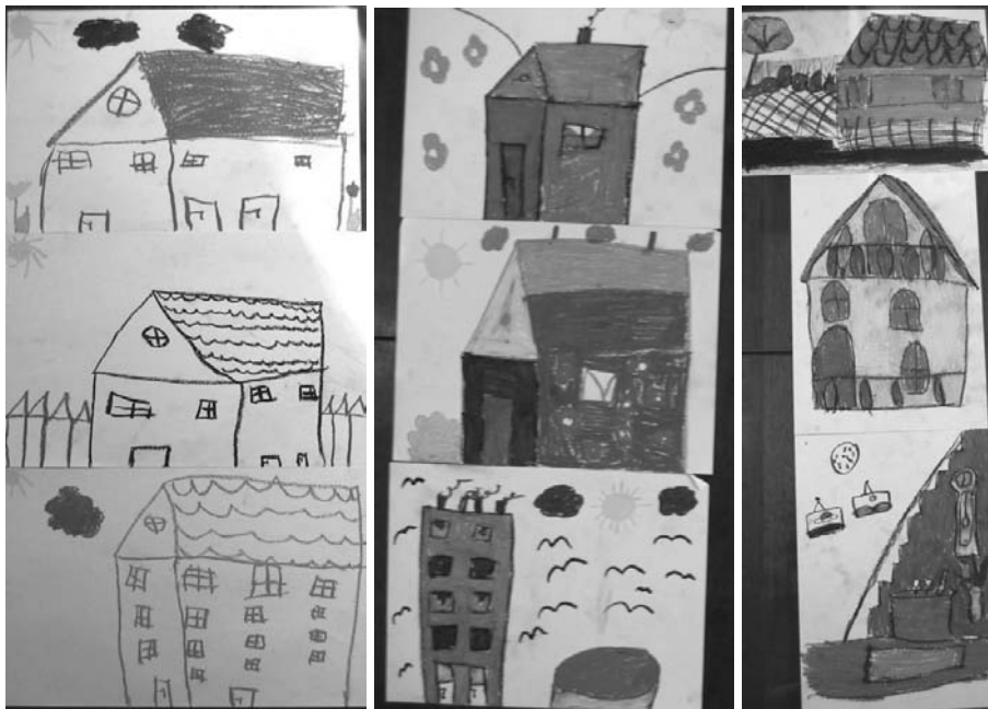
5. ábra Középosztálybeli álmok

A vágyak egy kisebb csoportja jól körvonalazható gyermeki, illetve mesebeli fantáziára utal, vagyis arra, hogy a gyerekek a jövőt valóban a jelenlegi, gyermeki nézőpontjából képzelel, és azokat a vágyakat vetíti ki a rajzokba, amelyeket most fontosnak tart. Ilyennek tekinthető a kiskutya, a ló, a hosszú csúszda, az állatot formázó ház, a fagyaltautomata, a királyi korona stb. megjelenítése. Ha jobban belegondolunk, minden rajztól ezt várnánk. A kérdés tehát az, hogy miért nem látunk minden rajzon ilyen gyermeki vágyakat és mi az, amit helyette látunk.